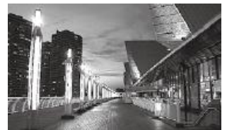
デイナイトカメラ