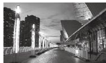
デイナイトカメラ