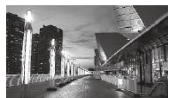
デイナイトカメラ